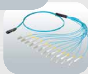
Service Cable Pré-Conectorizado